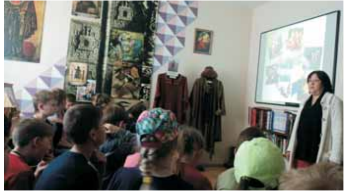
На КП «Метеобюро»