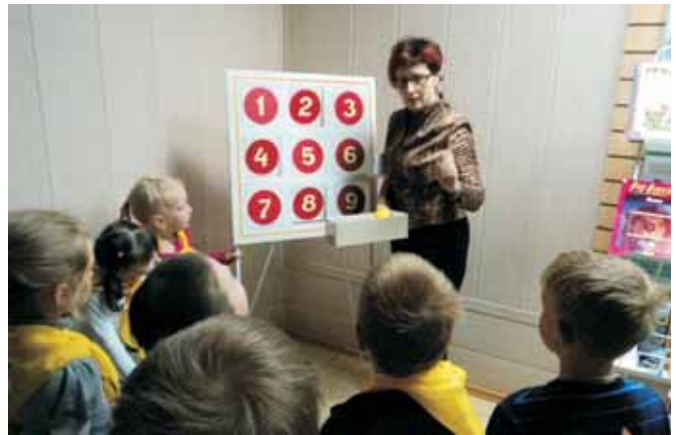
На КП «Сафари-парк»