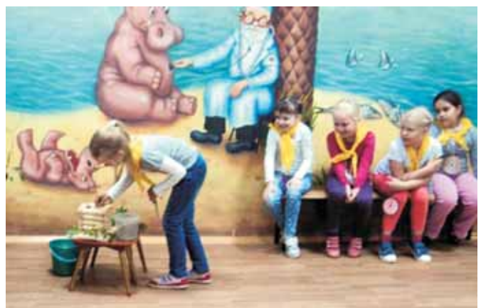
Участники набирают воду из колодца