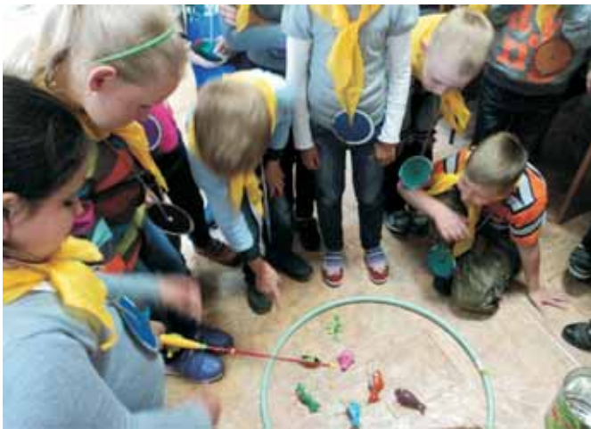
Игроки ловят рыбу