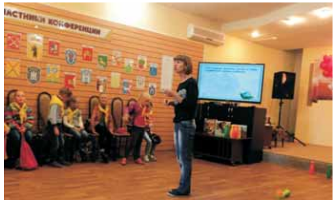
На КП «Школа безопасности»