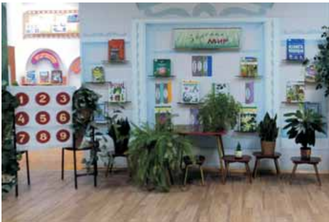
КП «Ботанический сад»