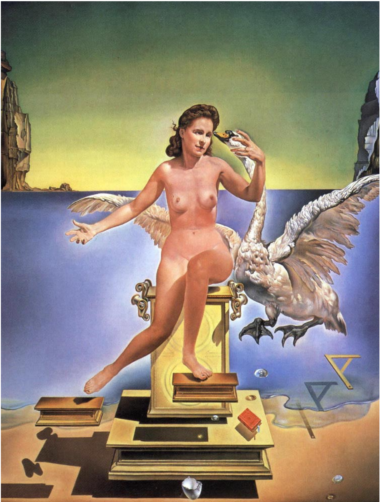
1949 Дали Леди Атомика