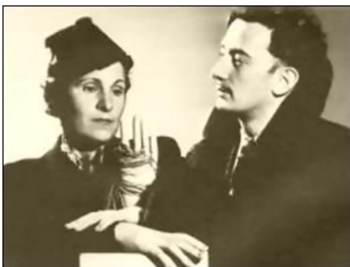
Сальвадор Дали и Гала

Героинями этой книги являются императрицы, принцессы, фаворитки, актрисы, певицы, поэтессы - женщины, чьи любовные истории овеяны легендами, а имена стали нарицательными. Среди них Клеопатра, Мессалина, Помпадур, Нефертити, а также звезды современного экрана - Дж. Коллинз, Тейлор и др. Перед вами открываются удивительные картины любовных историй - с древних времен до наших дней.