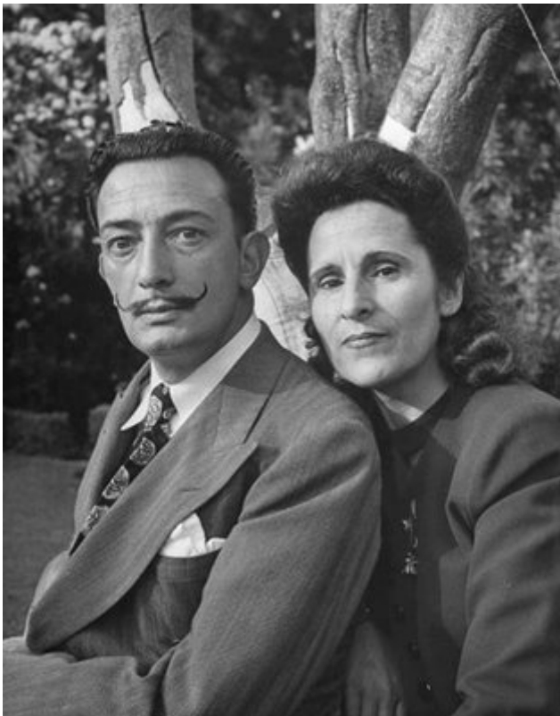
Сальвадор Дали и Гала