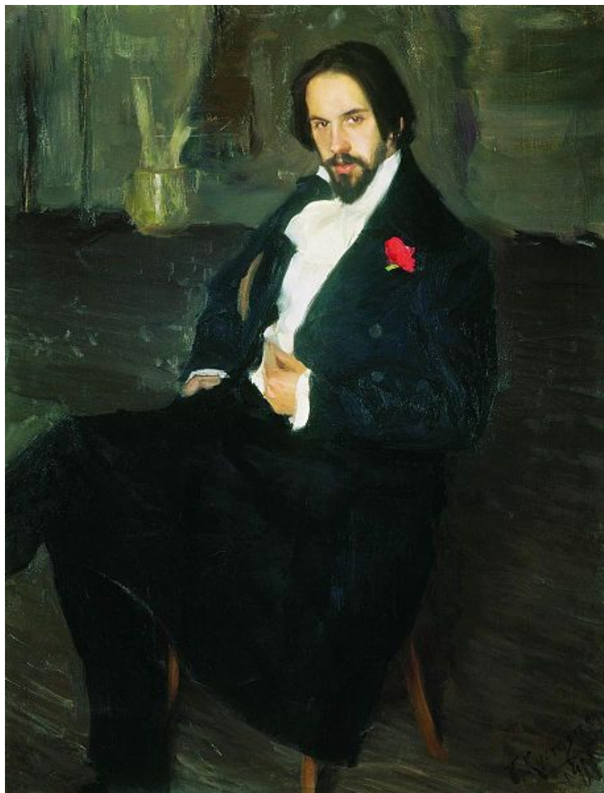
Портрет Ивана Билибина кисти Б Кустодиева 1901 год