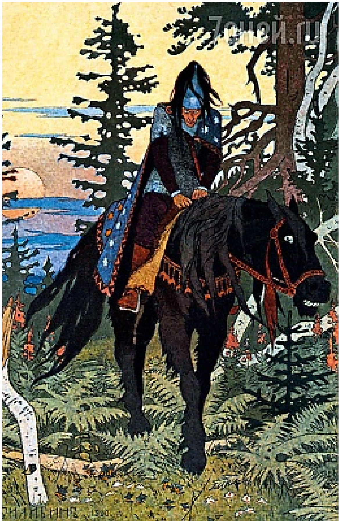
Библин И и его иллюстр к сказке Василиса Прекрасная