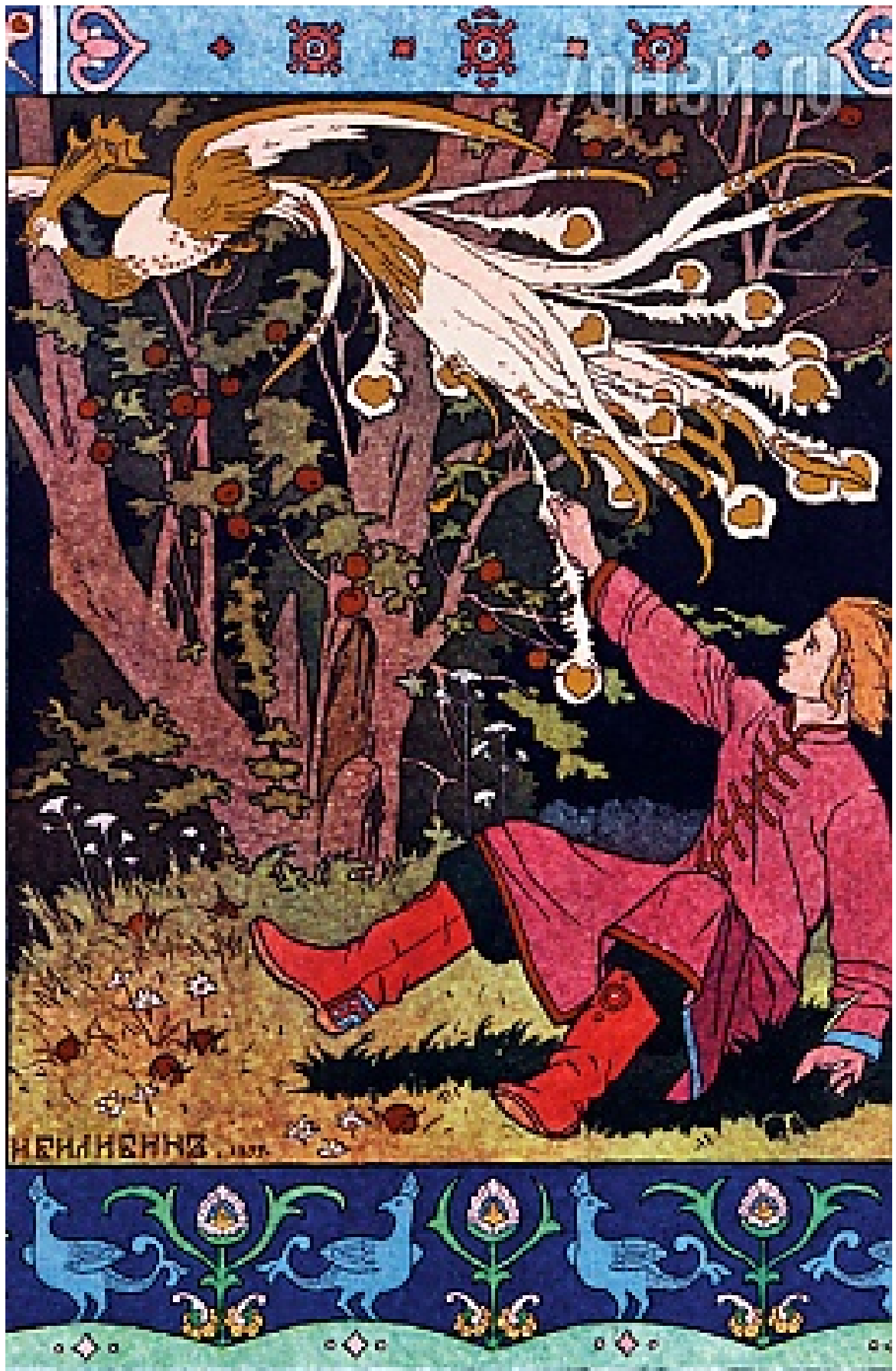
Билибин И Иллюстрация к сказке об Иване Царевиче