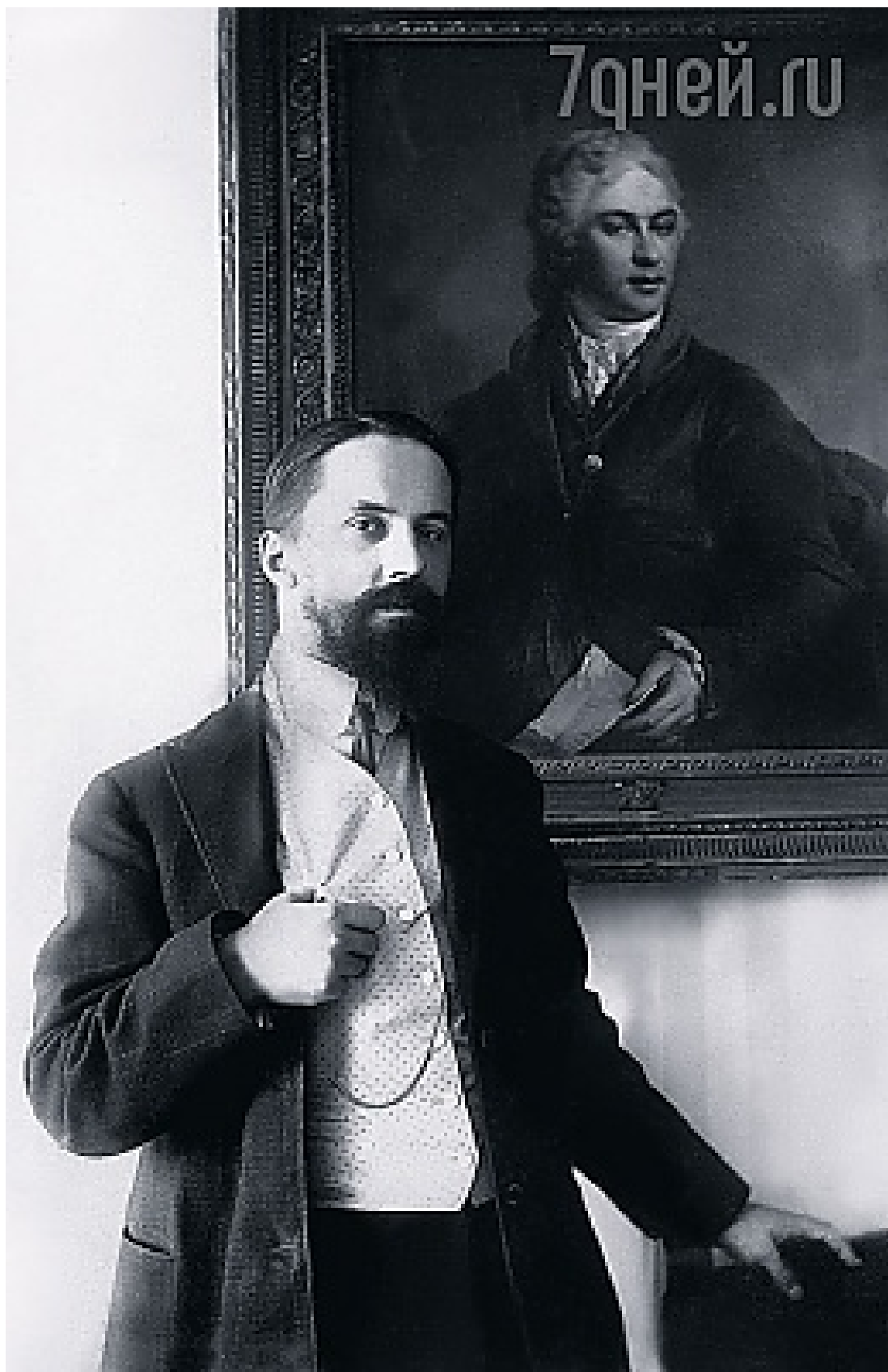
Библибин - Иван-железная рука