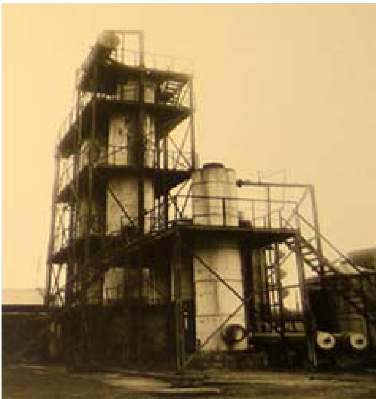
Установка В. Г. Шухова для термического крекинга нефти, 1931