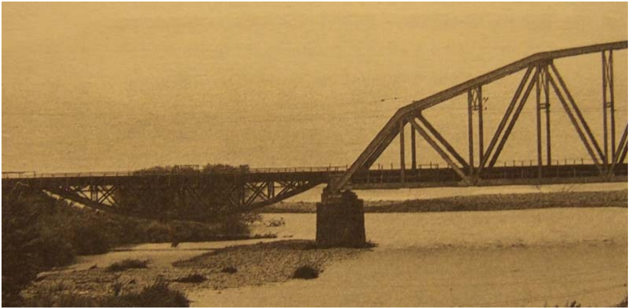
Железнодорожный мост конструкции Шухова через реку Аше у Сочи