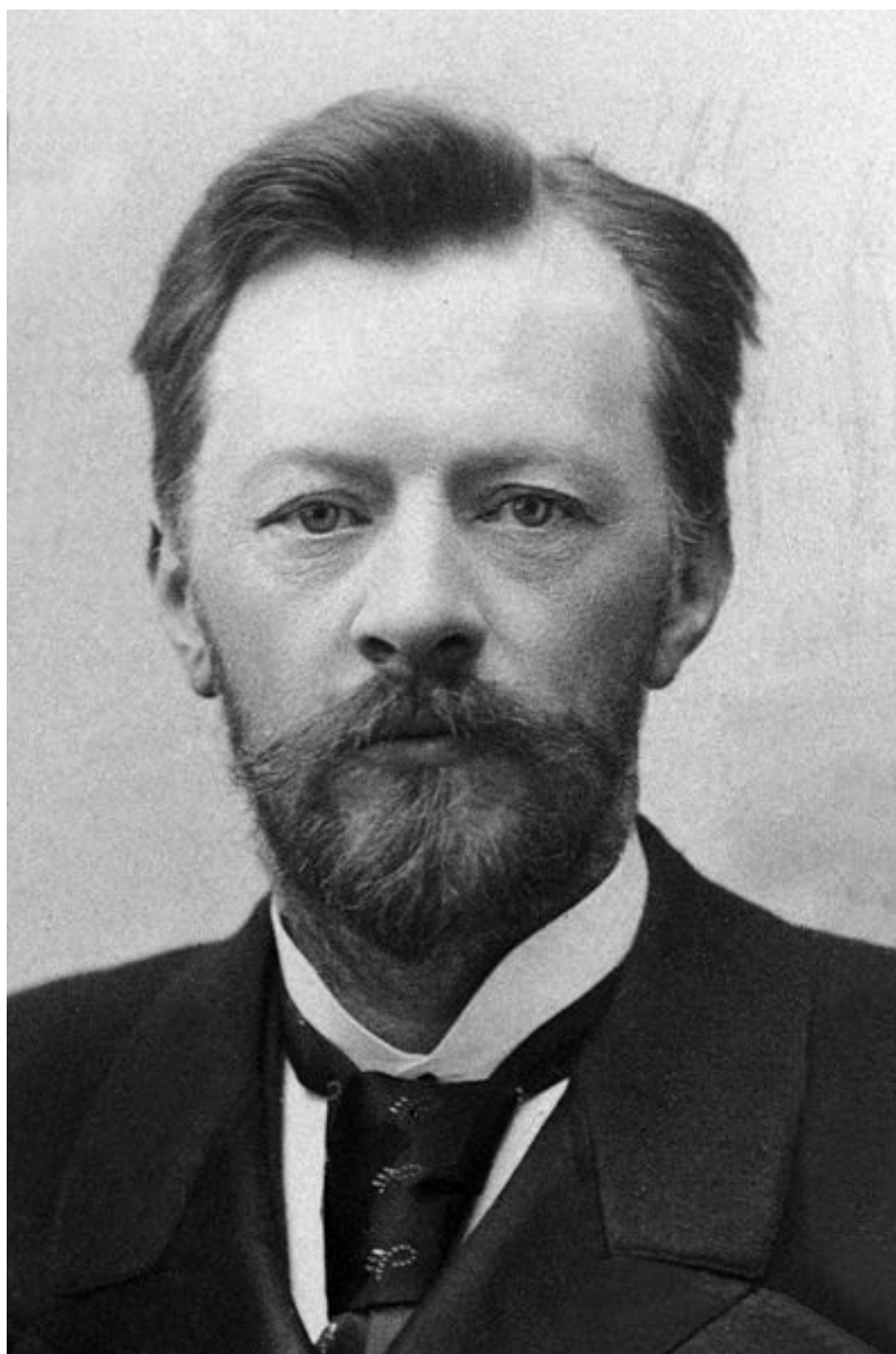
Вл-р Шухов инженер1891