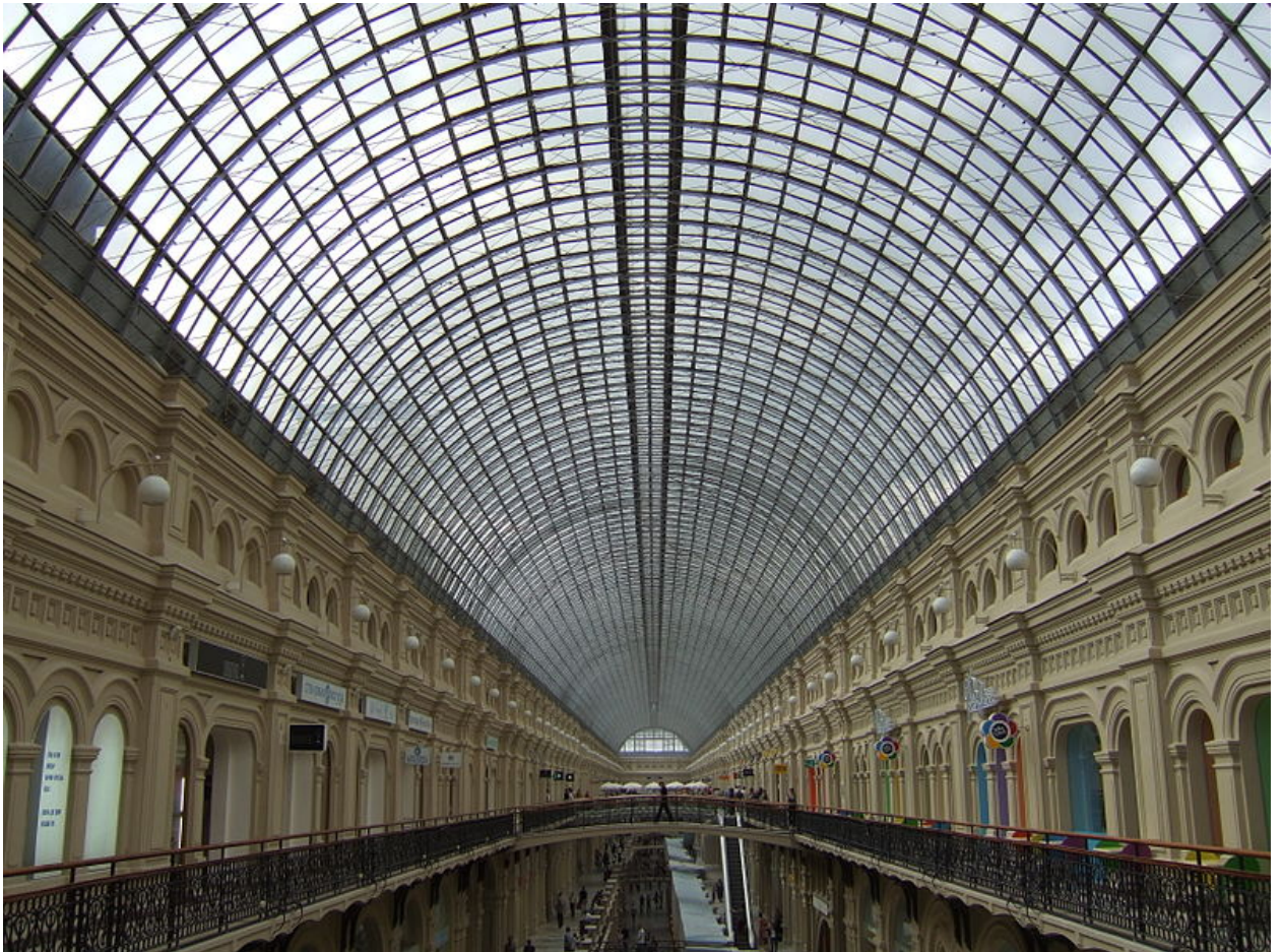
Металло-стеклянные перекрытия ГУМа конструкции Шухова, Москва