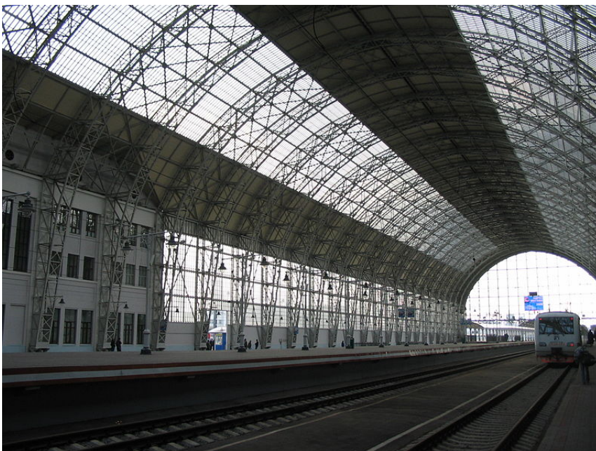
Шуховский металло-стеклянный дебаркадер Киевского вокзала в Москве