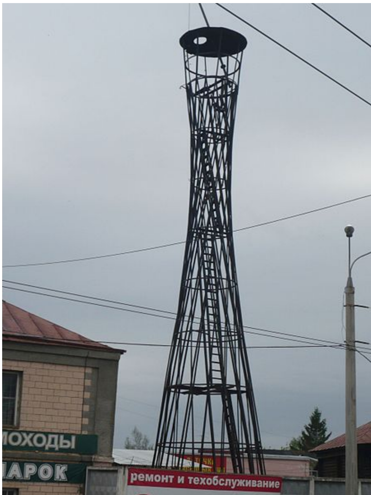
Башня Шухова в Копосове. Конец XIX в.(1896_г.)