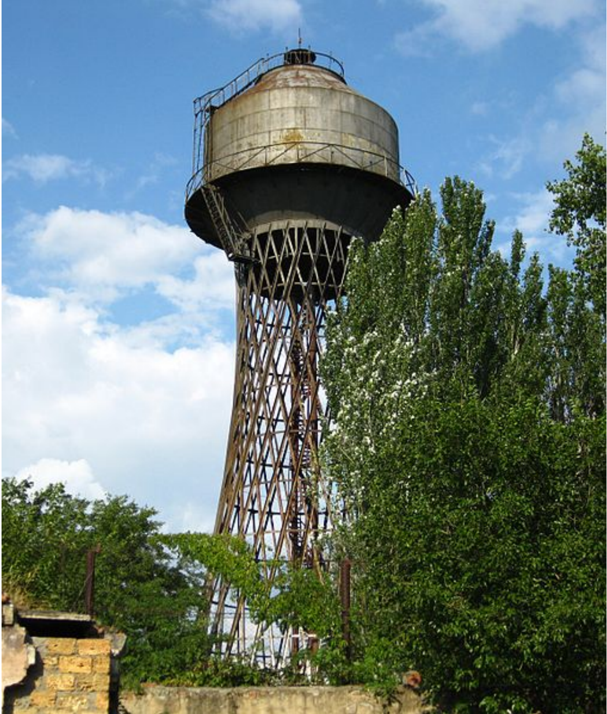
Гиперболоидная башня конструкции В. Г. Шухова в Николаеве