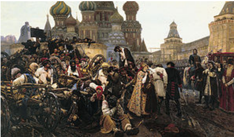
Утро Стрелецкой казни Суриков ВИi.jpg