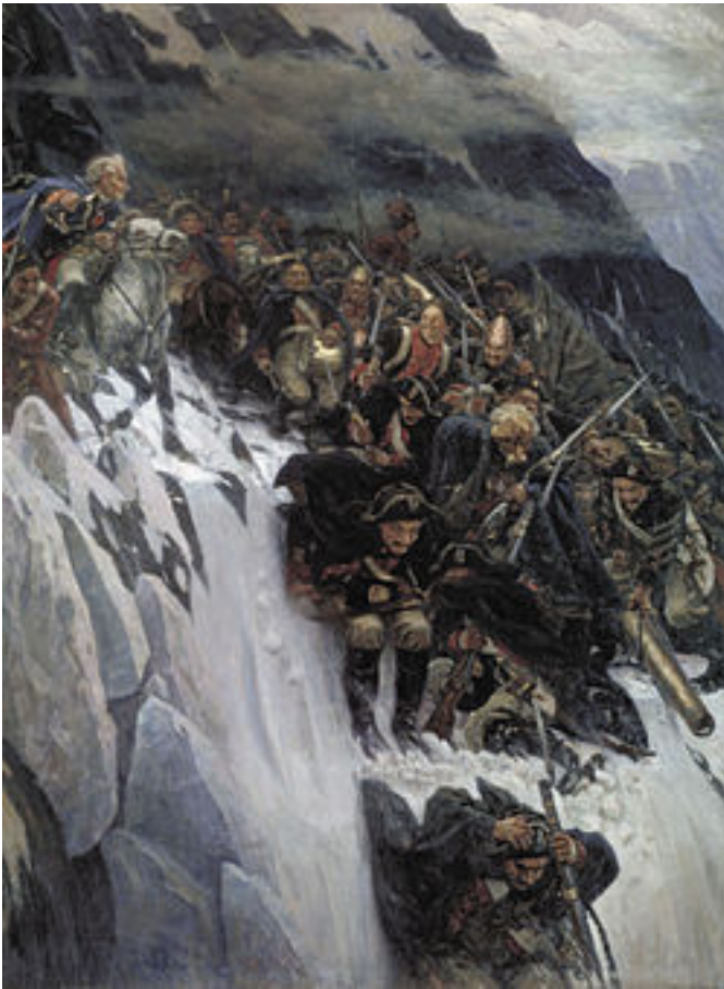
Переход Суворова через Альпы Суриков ВИ