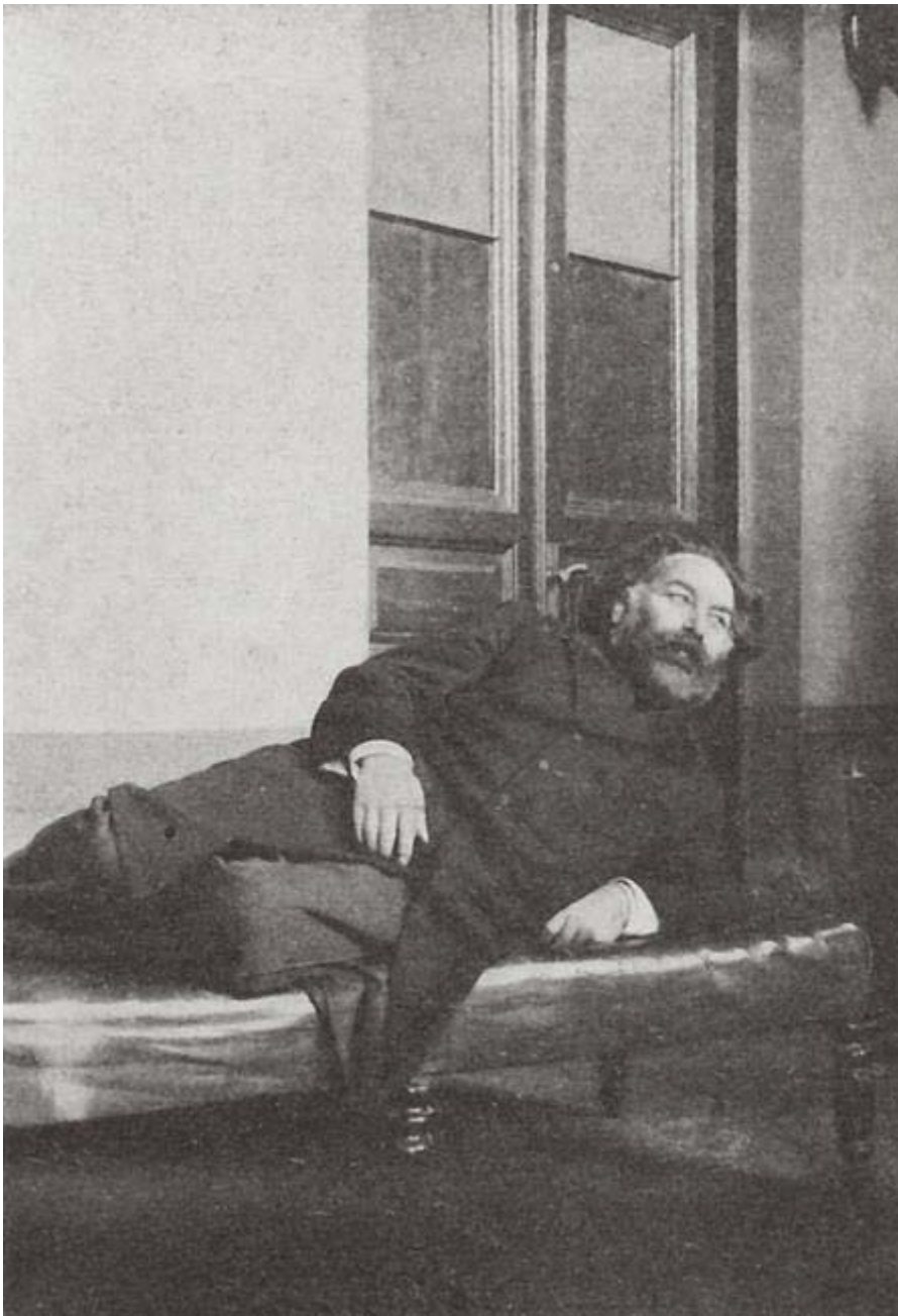
1896 Куинджи у себя в мастерской