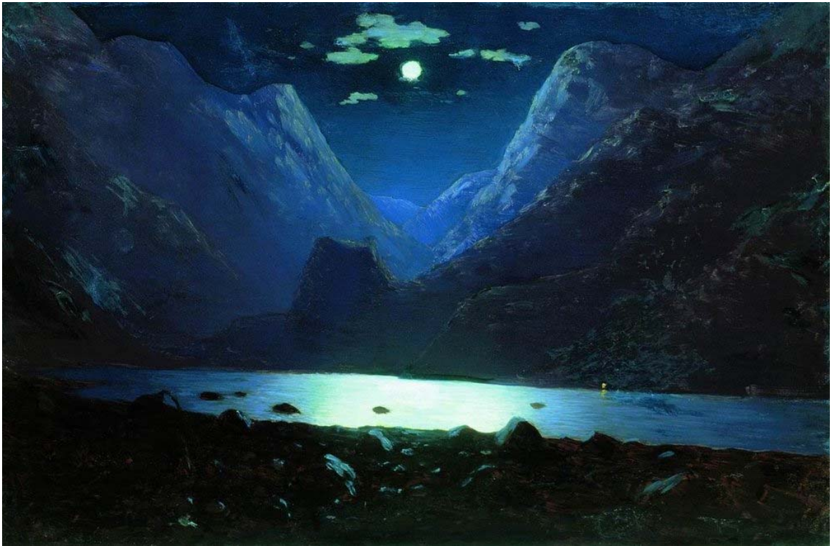
А Куинджи Дьявольское ущелье