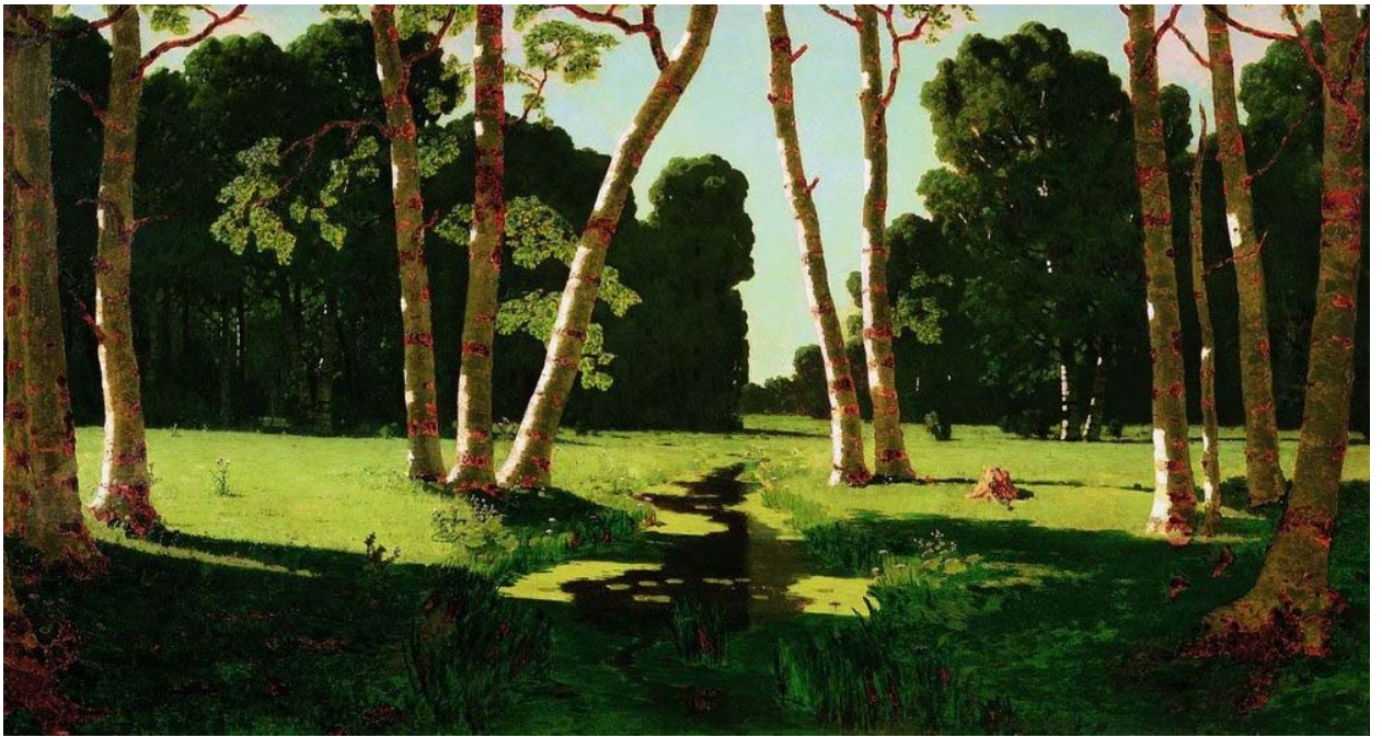
А Куинджи Березовая роща 1879