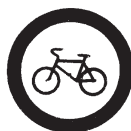
3.9 Движение на велосипедах запрещено

Шли из школы мы домой, Видим знак на мостовой: Круг, внутри велосипед, Ничего другого нет. Поразмыслил друг немного И сказал: «Ответ один – Знак гласит: ведет дорога Прямо в веломагазин».