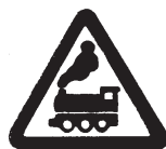
1.2 Железнодорожный переезд

Очень этот знак серьезен – Будь здесь очень осторожен. Говорит знак очень строго: Здесь железная дорога, Часто ездят поезда. Не играй здесь никогда!