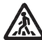
1.20 Пешеходный переход