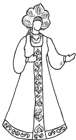
Костюм Марьи Искусницы