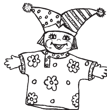
Перчаточная кукла «Скоморох»